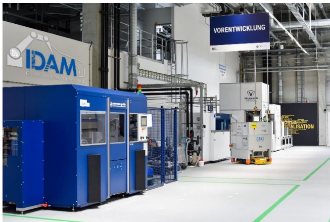
Bild 1: IDAM (Industrialisierung und Digitalisierung von Additive Manufacturing) hat die digital vernetzte, vollautomatisierte 3D-Druck-Fertigungslinie aufgebaut und vollständig in die automobilen Serienproduktion integriert.

Die Implementierung der Linien erforderte interdisziplinäre Expertise. Mit ihr konnten Digitalisierung, Automatisierung – im Maschinen- und Anlagenbau – in der Bauteilauslegung sowie im Bereich des metallischen 3D-Drucks realisiert werden. Das Fraunhofer-Institut für Lasertechnik ILT in Aachen unterstützte das Vorhaben durch seine langjährige Erfahrung im Bereich der Additiven Fertigungstechnologien. Den Projektpartnern war schnell klar, dass Lösungen „von der Stange“ den ambitionierten Projektzielen und den damit einhergehenden Produktivitäts- und Qualitätsansprüchen der Automobilindustrie nicht genügen. So musste ein Großteil der Module auf digitaler und physischer Ebene gänzlich neu entwickelt werden. Zudem ist ein erfolgreicher Betrieb der IDAM-Linien nur durch die enge Vernetzung der einzelnen Module möglich – selbiges wurde den Projektpartnern abverlangt. Vom inhabergeführten KMU bis zum Großunternehmen etablierte sich ab dem ersten Projekttag ein Spirit, geprägt vom gemeinsamen Streben nach Erfolg: Voneinander lernen, gemeinsam innovative Lösungen erarbeiten und die individuellen Stärken der einzelnen Partner bestmöglich zu Entfaltung zu bringen – für IDAM waren dies die Schlüssel zum Erfolg.